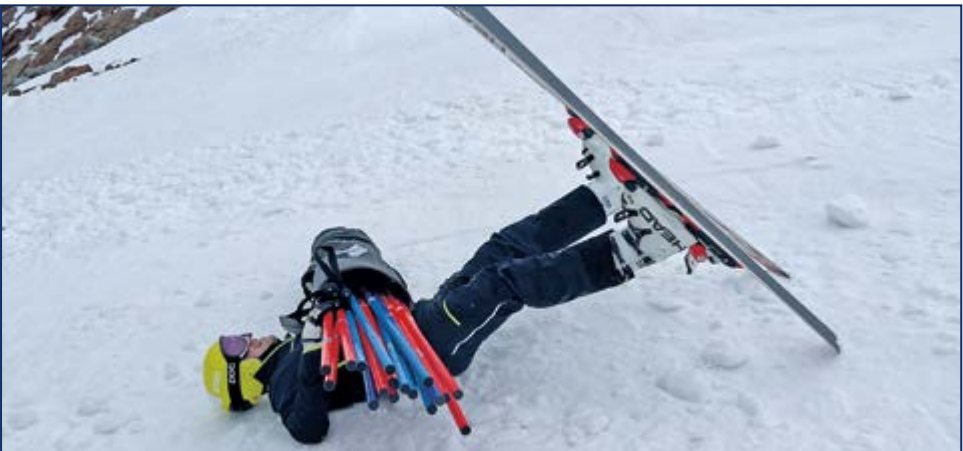
Uups! Irgendwas ging hier wohl schief...